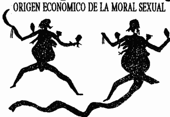
Pinturas rupestres alusivas a la danza y los ciclos lunares femeninos

Estas sociedades desperdician totalmente toda la fuerza de los machos excluidos, que son casi todos y que actúan como enemigos. Por lo tanto, son pobres e indefensas comparadas con las sociedades que aprovechan las aportaciones de todos los machos. La solución es que las hembras no se entreguen sólo a los machos dominantes